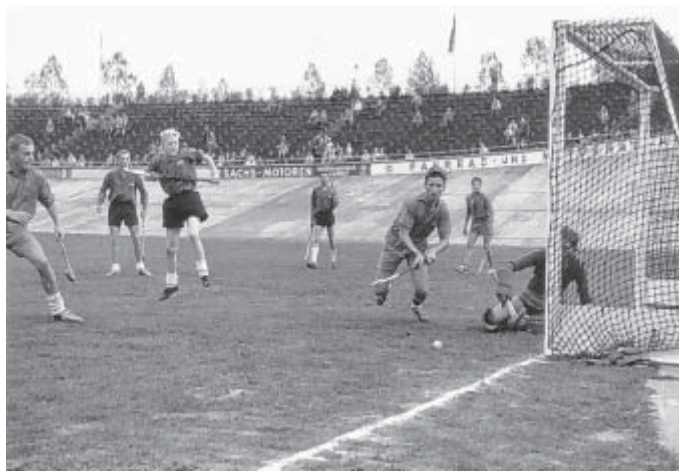
Hockeyplatz in der Radrennbahn: 1959 spielte zur Eröffnung des Platzes Arminia Bielefeld gegen den DHC Hannover.