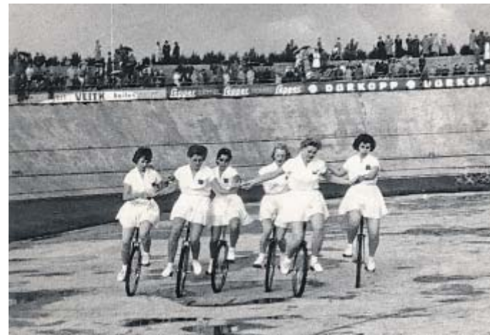
Einradfahren als Showeinlage: Vermutlich im Umfeld eines Radrennens gab es vor knapp 65 Jahren diese Darbietung.