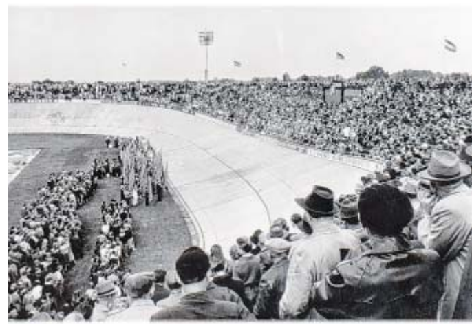
15.000 Menschen lauschten Erich Ollenhauer: Und 500 Kinder sangen 1957 beim SPD-Bezirksfest auf der Radrennbahn.