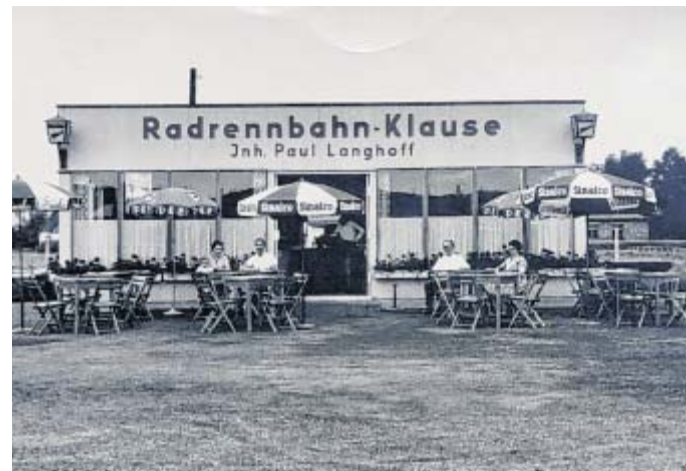
Fast vergessen: Die Radrennbahn-Klause (unter der Pächterfamilie Seitz) existierte von 1955 bis 1963 vor der Anlage.