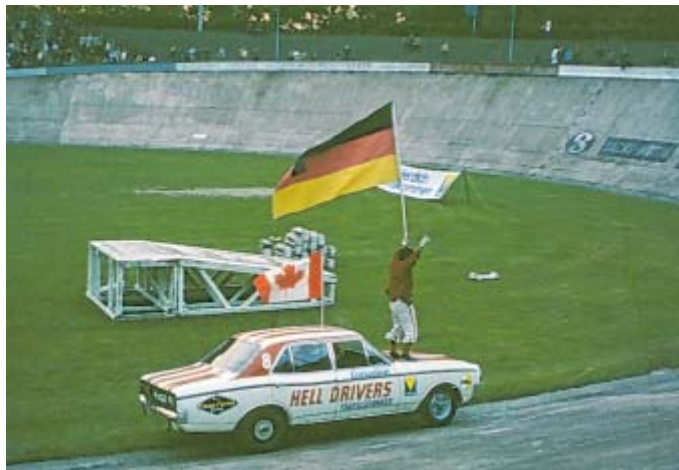
Canadian Hell Drivers: 1968 begeisterten die Stuntmen die Bielefelder mit ihren wilden Kisten auf der Radrennbahn.